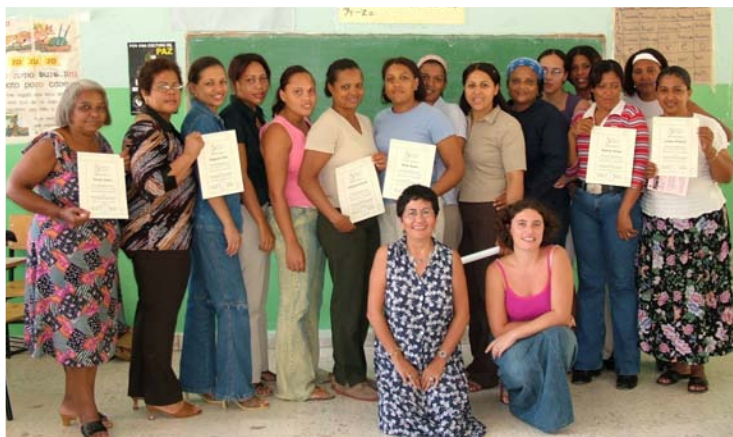
Grupos de mujeres de Villa González, junto con las facilitadoras en uno de los talleres de formulación de la Política Municipal para la Equidad de Género.

C Con el objetivo de profundizar en el diálogo entre los/as integrantes de la Sociedad Civil y el gobierno local, la Fundación Solidaridad incidió en la elaboración de esta propuesta de Política Municipal para la Equidad de Género, con el apoyo del Programa de Pequeñas Donaciones del Banco Mundial, auspiciando el Proyecto "Fomento del Desarrollo Local con Equidad de Género en Villa González".